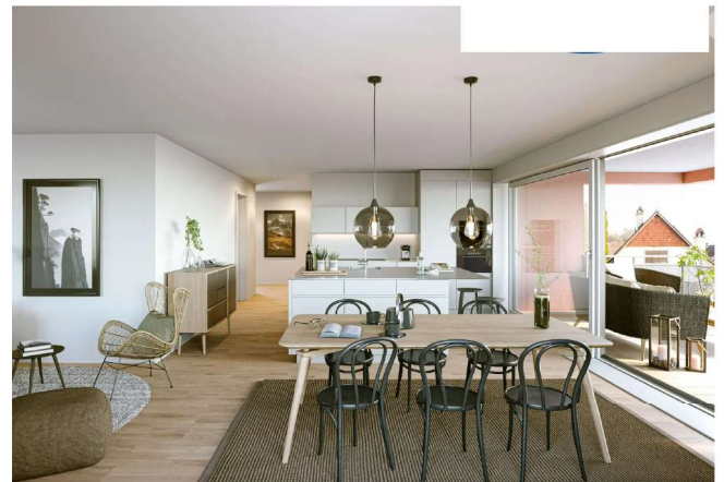
Der gemütliche Wohnbereich mit offener Küche lädt zum Verweilen ein

Wir kennen das Objekt und zeigen Ihnen gerne die entsprechenden Finanzierungsmöglichkeiten in einem persönlichen Gespräch auf.